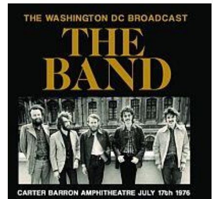
Forever Young - The Band .

Microsoft Translator gebruiken in Microsoft Edge-browser. Een aantal Engelse websites zijn zeer de moeite waard. Met de nieuwe Microsoft Edge zijn deze websites goed te lezen, de vertaling is bijzonder goed. Er worden meer dan 60 talen ondersteund. De browser vraagt u automatisch een webpagina te vertalen wanneer de pagina die u wilt openen, in een andere taal wordt weergegeven dan de pagina's die worden vermeld onder de voorkeurstalen in instellingen. Microsoft Translator gebruiken in Microsoft Edge-browser.