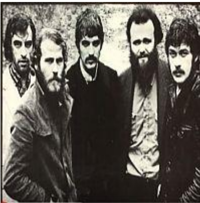
The Weight - The Band.

The Band: Once Were Brothers. Ze gingen dwars tegen de tijdgeest in. Terwijl hun generatiegenoten opzichtig rebelleerden tegen alles wat ook maar riekte naar de wereld van hun ouders, gingen de vijf leden van The Band voor hun debuutalbum Music From Big Pink pontificaal op de foto met hun families. Het bleek de ideale illustratie van hun muzikale attitude: in de hoogtijdagen van de psychedelische pop ging de Canadese groep in 1968 ongegeneerd terug naar de basis. Met zwaar dooraderde muziek, die we sindsdien 'americana' zijn gaan noemen. Gemaakt op het tijdloze kruispunt van folk, country, rock, blues en pop. The Band: Once Were Brothers.