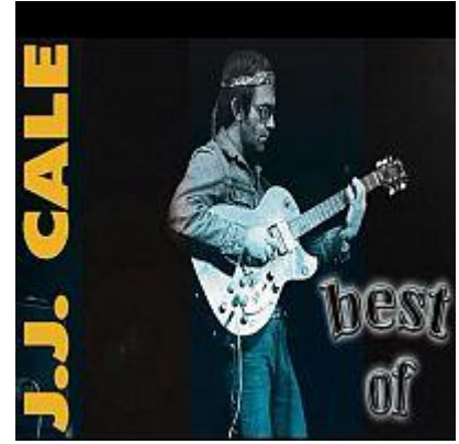
Best Of JJ Cale - Non-Stop Greatest Hits.