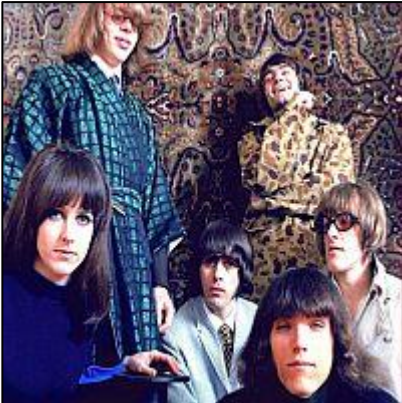
Jefferson Airplane Somebody To Love, White Rabbit Live 1967

Minimalistische muziekspeler om uw muziekbibliotheek te beheren. Als u uw muziekcollectie nog op uw computer heeft staan, dan heeft u een audiospeler nodig om uw favoriete tracks mee af te spelen. Het lichtgewicht audiospeler waarmee u zonder problemen allerlei audiobestanden afspeelt. Het programma is tot op zekere mate naar uw eigen wensen aan te passen en nog uit te breiden, waardoor er meer mogelijkheden ontstaan. U beheert simpel uw muziekcollectie, maakt afspeellijsten aan, voegt tags toe aan bestanden en de software heeft nog een ingebouwde converter, om bestanden naar een ander formaat om te zetten. FoxTunes is gratis te gebruiken en de software is beschikbaar voor Windows. Minimalistische muziekspeler om uw muziekbibliotheek te beheren.