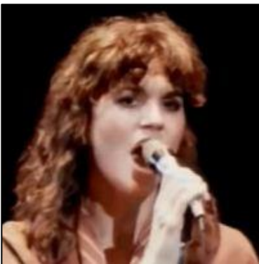
Linda Ronstadt Documentary Movie.

Focusli: achtergrondmuziek. Op deze website kan je van verschillende effecten (water, wind, natuur, het geluid van een windvanger en meer) een mengeling maken die je rust geeft, zodat je deze geluiden als achtergrond kan gebruiken wanneer je je moet focussen bij het werk. Of gewoon, om tot rust te komen.[Taal:ENG] Focusli: achtergrondmuziek.