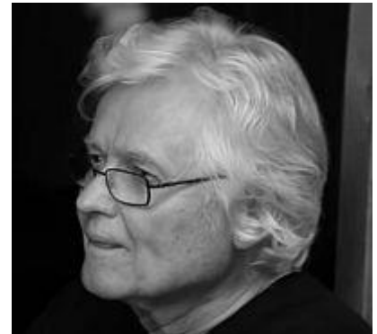
Fuck All The Perfect People - Chip Taylor & The New Ukrainians