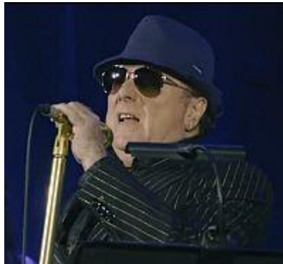
Van Morrison - Bring It On Home To Me (Live At Porchester Hall, London / 2017)