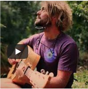
Xavier Rudd - Follow The Sun

Extreme, Brad Paisley en Game Of Thrones componist Ramin Djawadi versnipperen over de geheel nieuwe Sigil Collection gitaren uit The Fender Custom Shop. The Game of Thrones Sigil Collection. The Game of Thrones Sigil Collection.