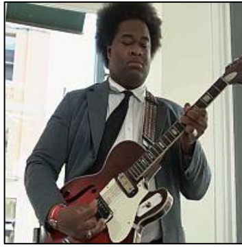
Delvon Lamarr Organ Trio - Warm-up Set (Live on KEXP).